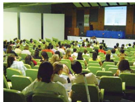
Simpósio Rio de Janeiro