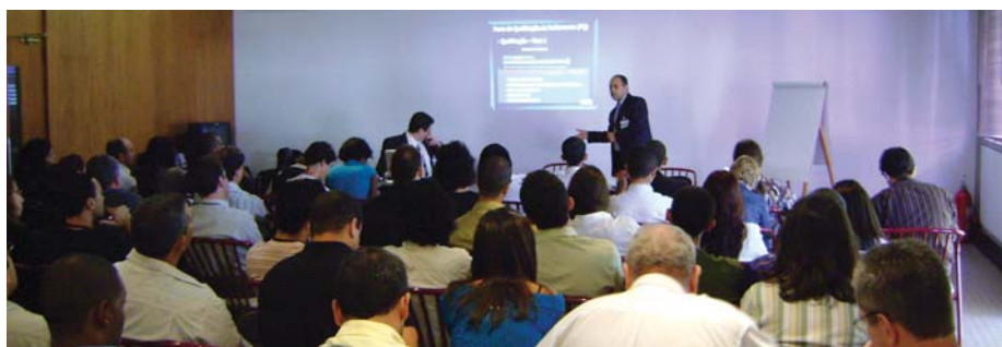
Workshop Rio de Janeiro

- maio/2008 – Rio de Janeiro - RJ: Auditório do Farmanguinhos Fiocruz - maio/2008 – Ribeirão Preto – SP: palestra no Curso de pós-Graduação em Tecnologia Farmacêutica da Universidade Estadual de Ribeirão Preto - UNAERP