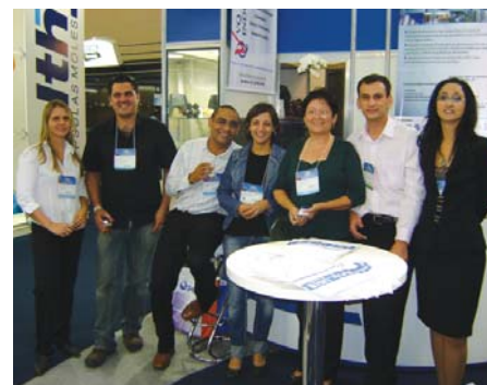
FCE Pharma 2008

“A realização de eventos com temas simples como estes de validação de sistema água têm surpreendido a todos, pois questões básicas relativas à qualificação e a estratégia de amostragem se mostraram tão presentes quanto à parte de documentação relativa aos protocolos, que são velhas incógnitas para empresas na área de saúde de pequeno e médio porte em todo o Brasil. Estes eventos, além de levar o conhecimento técnico em linguagem clara e objetiva, nos orienta sobre como contratar serviços qualificados sem desperdícios ou riscos regulatórios, seja por razões de falha de comunicação com o laboratório contratado, seja pela real falta de conhecimento dos profissionais contratantes.”